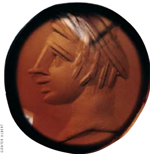
Abb. 13: Ringstein (Gemme) aus orangefarbenem Karneol mit der Darstellung des Merkur mit Flügelhaube. Originalgröße 1,0 cm.