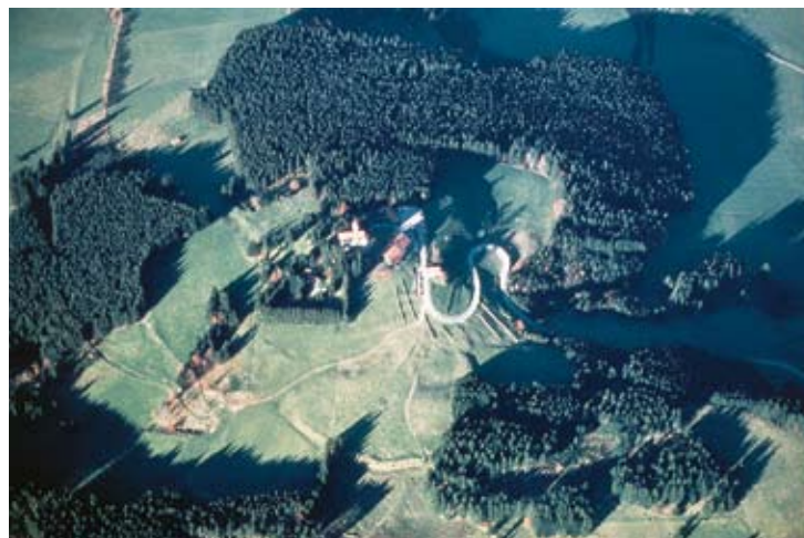
Abb. 3: Die zentrale Befestigung des Auerberges ist südlich der Kirche (unten) in der Wiese als Wall und Graben, im Norden als Waldgrenze sichtbar. Luftbild-senkrechtaufnahme.