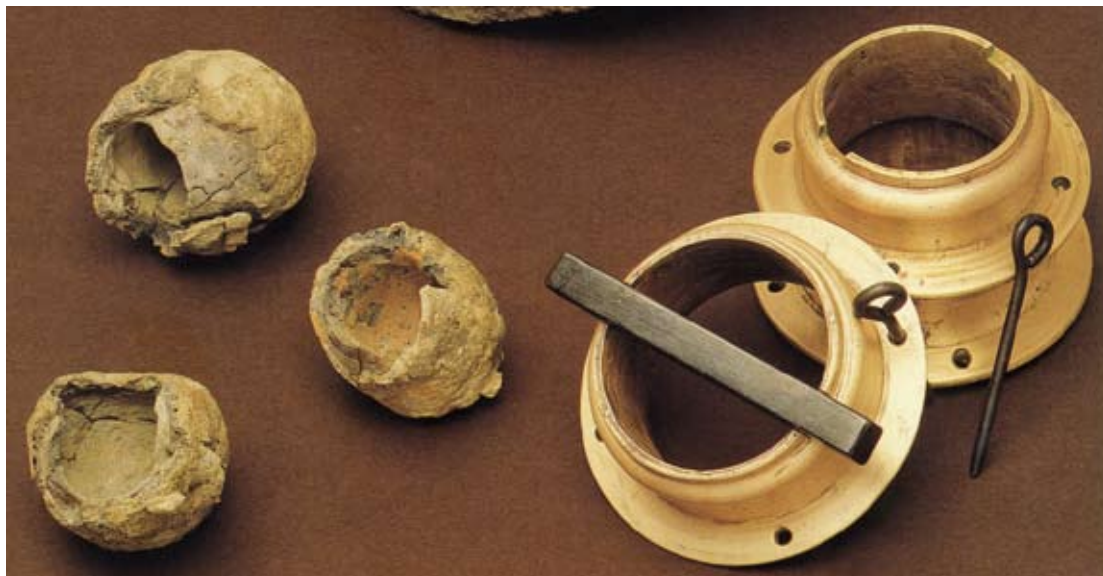
Abb. 9: Drei Gusstiegel aus Ton und moderne Nachgüsse von massiven Spann- buchsen ( modioli ) römischer Tor- sionsgeschütze, nach originalen Gussformen aus Ton vom Auerberg. Innendurchmesser 11 cm.