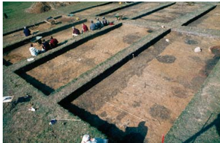
Abb. 6: Westplateau. Frei gelegte Grabungsflächen mit den dunkleren Spuren der römischen Bebauung.

Bei den zu erwartenden Spuren reiner Holzarchitektur musste die Methode einer breit angelegten