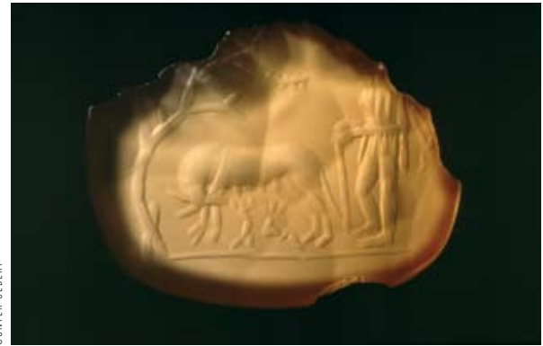
Abb. 11: Ringstein (Gemme) aus orangefarbenem Karneol mit Darstellung des Lupercal: Im Zentrum die Wölfin (Lupa Romana), unter ihr die göttlichen Zwillinge. Am linken Bildrand der Feigenbaum ( Fica ruminalis ), rechts der Hirte Faustulus. Originalgröße 1,5 x 1,1 cm.