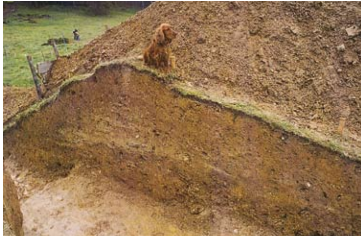
Abb. 4: Ein Grabungsschnitt durch den Südwall. Deutlich erkennbar ist der hell geschichtete Wallkern.

1953 abgesehen, ruhte die Auerbergforschung bis in die 1960er Jahre, als erneut eine mehr emotionale als auf konkrete Befunde gegründete Diskussion um das alte Thema „Kelten am Auerberg“ entbrannte.