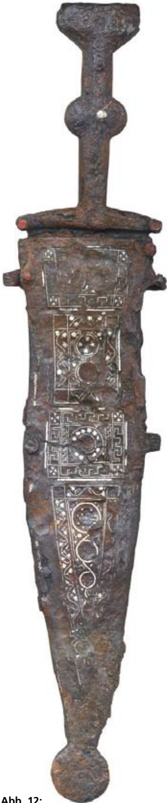
Abb. 12: Römischer Militärdolch ( pugio ) in einer mit Silber- und Emailinlagen reich und kunstvoll verzierten, kostbaren Dolchscheide. Gesamtlänge des Dolches mit Griff 37 cm.

vermutet, dass auch beim Bau der Erdbefestigung römisches Militär beteiligt war.