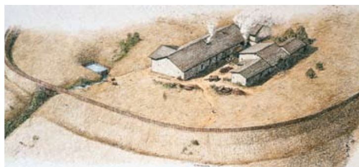
Abb. 8: Rekonstruktionsversuch des fabrica -Gebäudes mit dem Brauchwasserbecken auf dem Ostplateau.

und kalten Winter. Überraschend war der ausgezeichnete Erhaltungszustand eines 3 x 1,50 m großen hölzernen Troges, einer latrina aus Tannen- und Fichtenholz in einem größeren Holzgebäude auf einer etwas höher gelegenen Wohnterrasse. Aufschlussreich waren die organischen Reste am Boden des Troges. Die artliche Zusammensetzung der pflanzlichen Funde