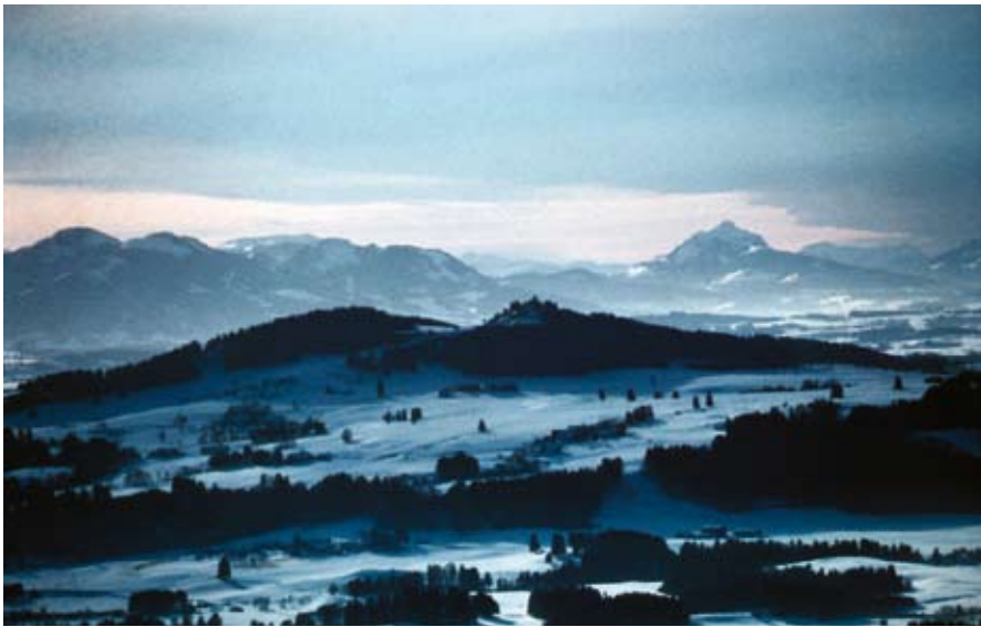
Abb. 1: VON GÜNTER ULBERT Der Auerberg, im Hintergrund die Allgäuer Alpen. Luftbild von Nordosten.

EINE RÖMISCHE BERGSIEDLUNG DES FRÜHEN 1. JAHRHUNDERTS N. CHR.